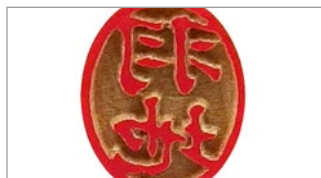
訂正印(アカネ 小判6.0mm)