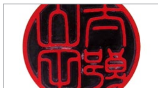
カクテルカラー(アクリル樹脂製)